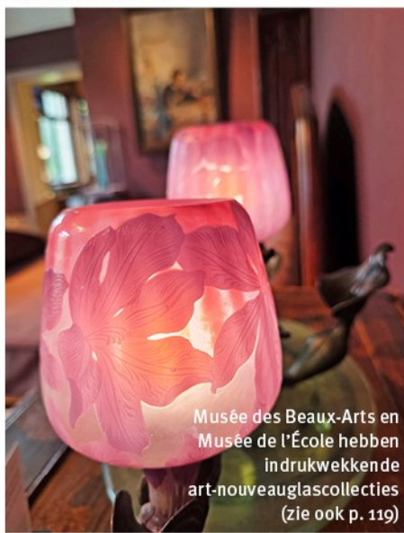
Musée des Beaux-Arts en Musée de l'École hebben indrukwekkende art-nouveauglascollecties (zie ook p. 119)