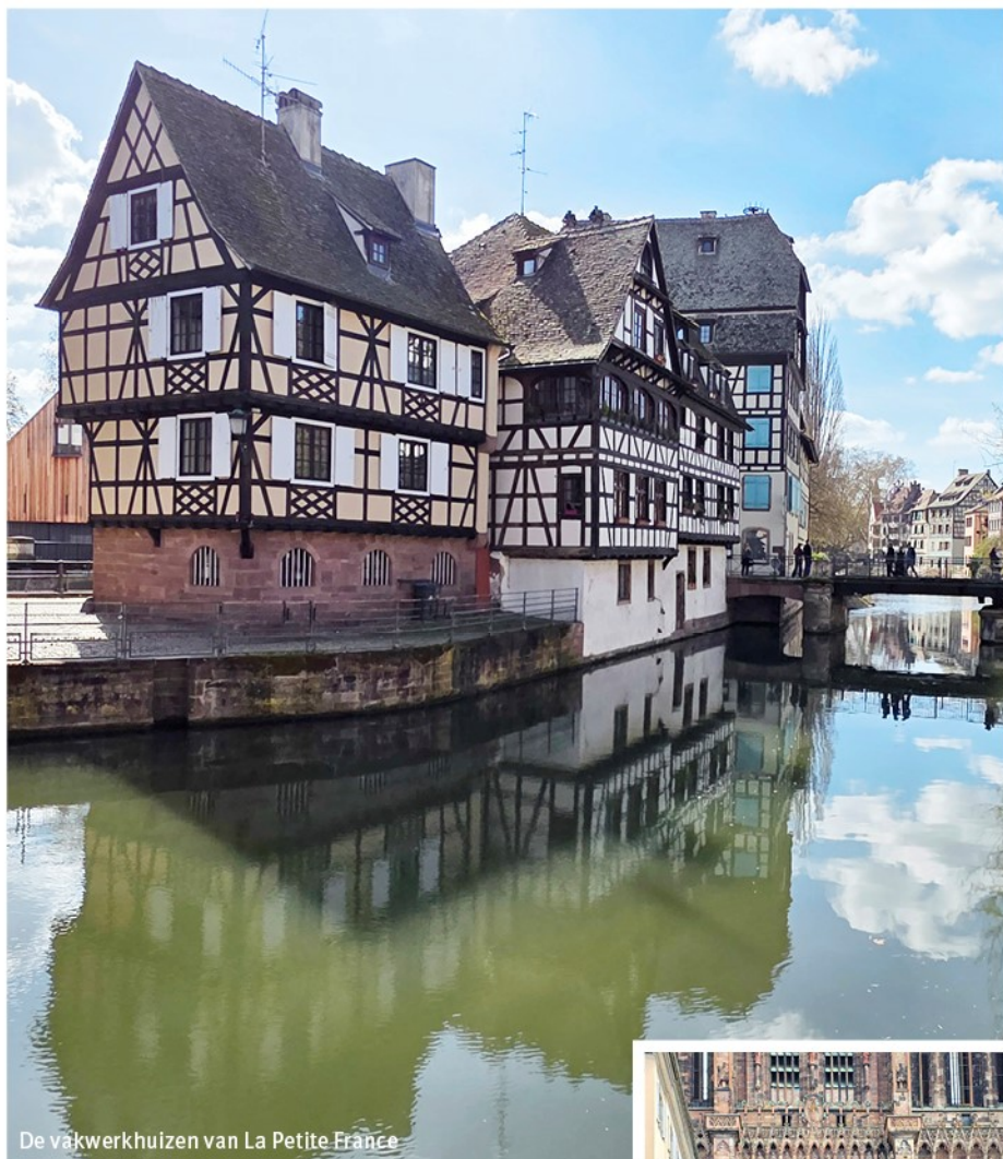
De vakwerkhuisen van La Petite France

Een wijnbeurs waar producenten uit heel Frankrijk samenkomen. Je kunt hier proeven, ontdekken en praten met wijnmakers. Auxvignobles.fr