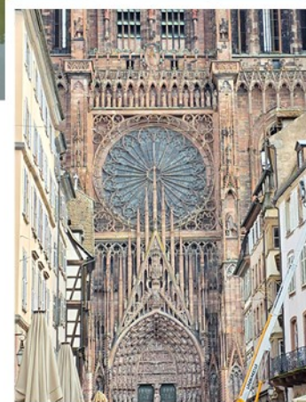
De kathedraal Notre-Dame de Strasbourg met roze zandstenen gevel en een prachtig roosvenster