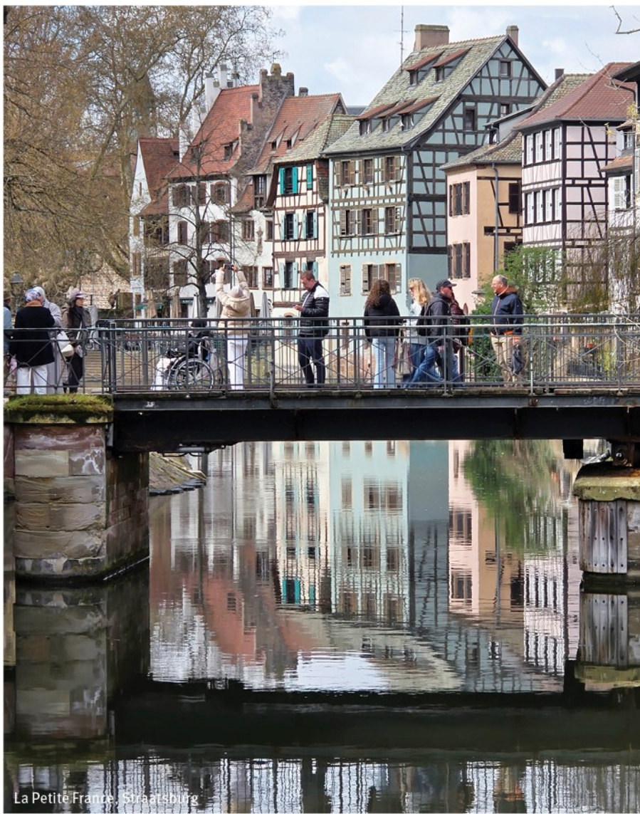
La Petite France, Straatsburg