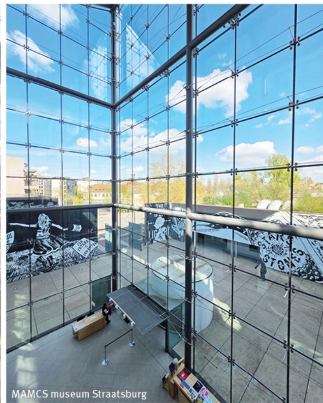
MAMCS museum Straatsburg