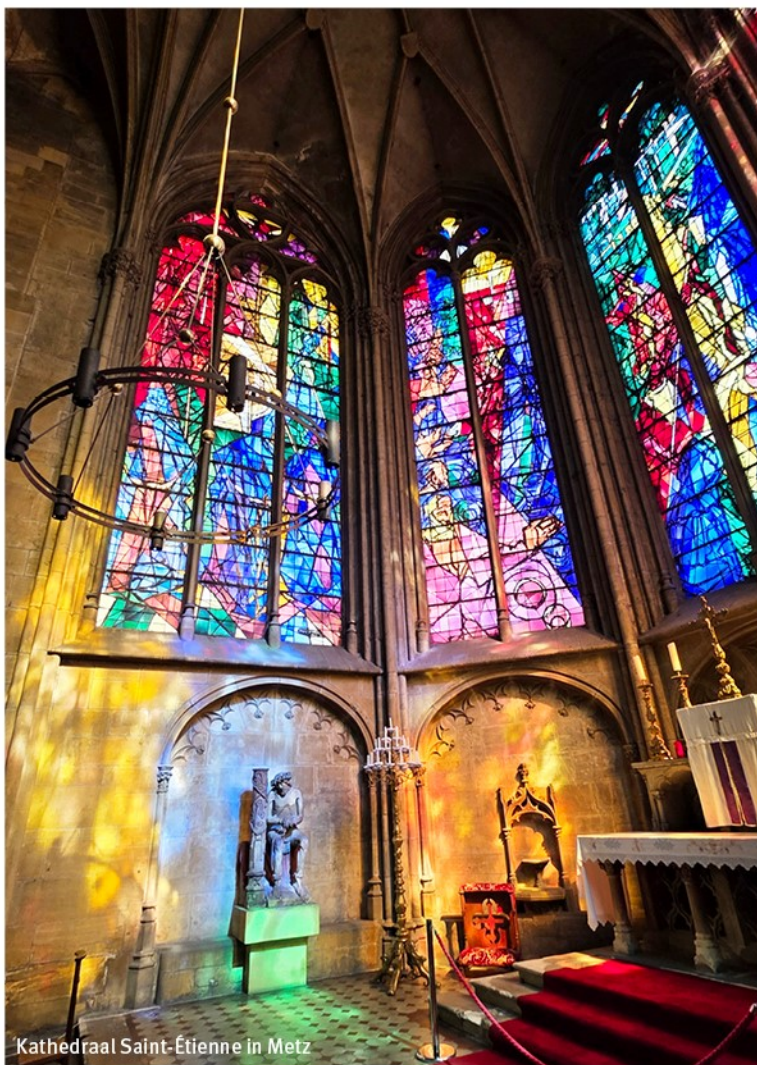
Kathedraal Saint-Étienne in Metz