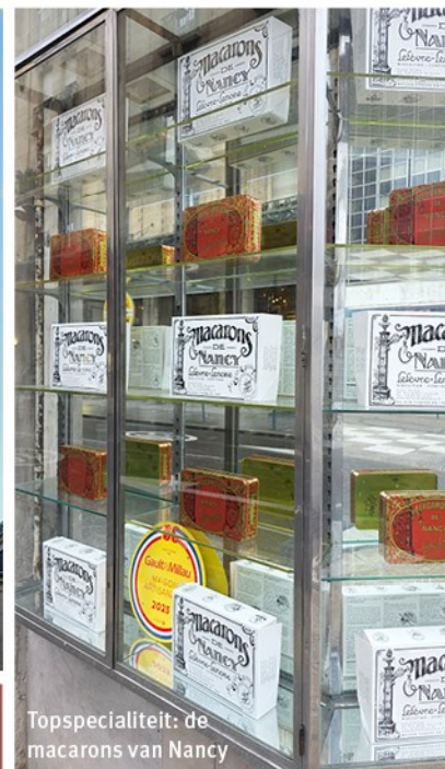
Topspecialiteit: de macarons van Nancy