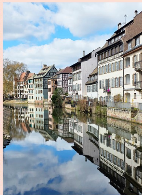
Van links naar rechts: Place Stanislas in Nancy, kathedraal Saint-Étienne in Metz, La Petite France in Straatsburg