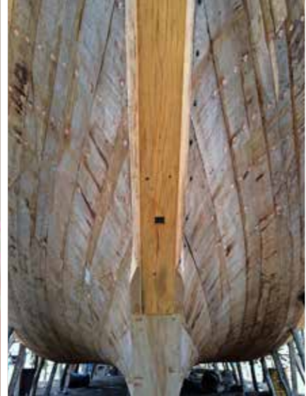
Scheepswerf in Sur, waar de traditionele Dhow boten worden gemaakt

■ Sultan Qaboos Grand Mosque: het paradepaardje van Muscat. Eyecatchers in het gebedshuis zijn de 14 m hoge kristallen kroonluchter van Swarovski, het handgemaakte Perzische gebedskleed (1700 miljoen knopen) en de rivaqs , gangen met mozaïeken.