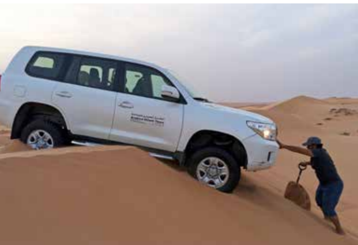
De fourwheeldrive is even vastgelopen tijdens het scheuren over de woestijnheuvels ( dune bashen )