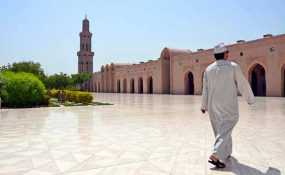
De Sultan Qaboos Grand Mosque is gebouwd uit 300.000 ton Indische zandsteen