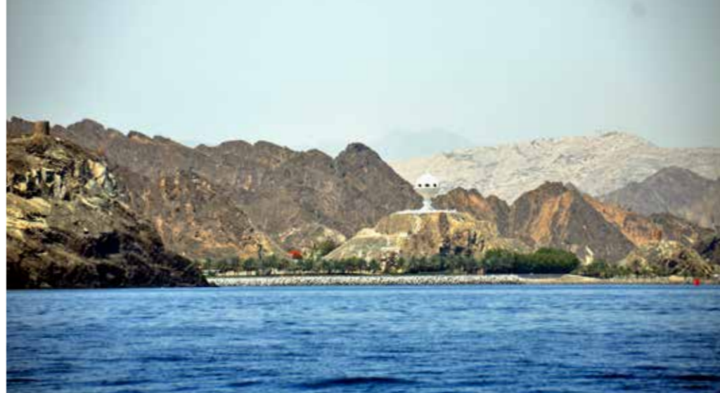
Enorme wierookbrander, tevens uitkijktoren op de bergen rond de stad