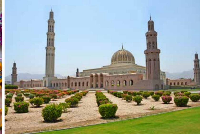
Het moskeecomplex beslaat ongeveer 40.000 vierkante meter