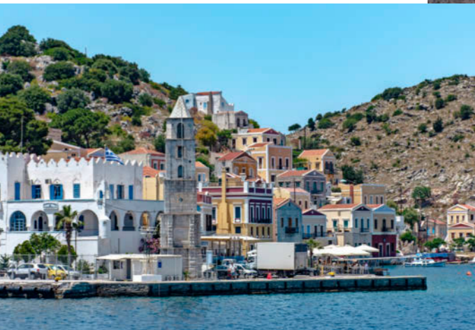
Met de klok mee: • Schildpadden spotten bij de grotten van Zakynthos • Symi-stad