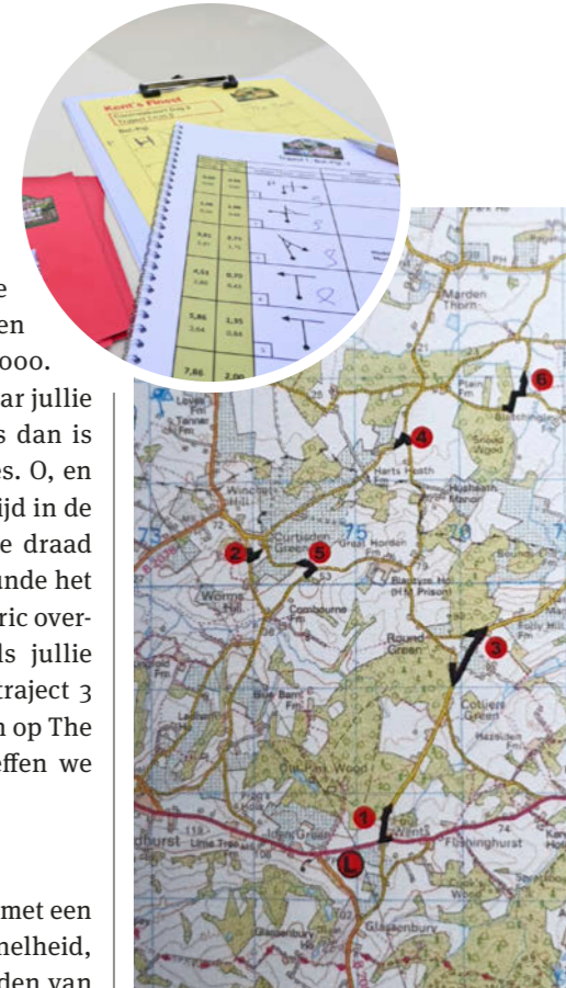
Punt-tot-puntroutes, magneetritten en bol-pijltraject, rallyrijden is nog net geen hogere wiskunde

Een Classic Car Rally is een toertocht met een recreatief aspect. Het gaat niet om snelheid, maar om het zo accuraat mogelijk rijden van een puzzelroute aan de hand van de diverse navigatiemethodes. Had ik me voor het boeken beter ingelezen, dan had ik meteen kunnen zeggen dat de rallysport niets voor ons is. We houden niet van klassemmentsproeven en zijn beiden niet competitief ingesteld. Ik dacht alleen maar: romantisch, een paar dagen met mijn lief over het Engelse platteland toeren. ▶