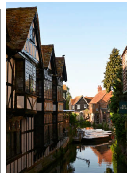
Boven: Het middeleeuwse Dover Castle is het grootste kasteel in Engeland Onder: Canterbury is één groot openluchtmuseum

we die tip gisteren maar gekregen. “Kijk daar, de letter Z. Nu 850 meter doorrijden en dan komt er als het goed is een kruising. Daar gaan we rechts. Opeens voelen we ze, de rallykriebels. Maar ons geluk is van korte duur, want niet lang daarna zijn we de weg weer kwijt. Mijn schuld. Ik kijk in mijn enthousiasme verkeerd en tel de cumulatieve meters in plaats van de absolute. En natuurlijk komen we daar pas na twintig minuten rijden achter. We laten ons niet uit het veld slaan. Pakken dezelfde weg terug, tot het laatste controlepunt. Die vinden we, maar vervolgens niets. We rijden weer terug, pakken de tweede afslag. Nog steeds geen controlepunt. Dat is jammer, want bol-pijltrajecten worden gereden zonder kaart. Zie dan maar eens je route te vervolgen. ‘Zijn jullie al bijna in de buurt van de koffiestop?’ appt Eric. We durven bijna niet te zeggen dat we opnieuw zijn verdwaald. Volgens de navigatie is het nog ruim een half uur rijden naar het Spitfire & Hurricane Memorial Museum in Ramsgate. Eric stelt voor dat we lekker ons eigen plan trekken. ▶