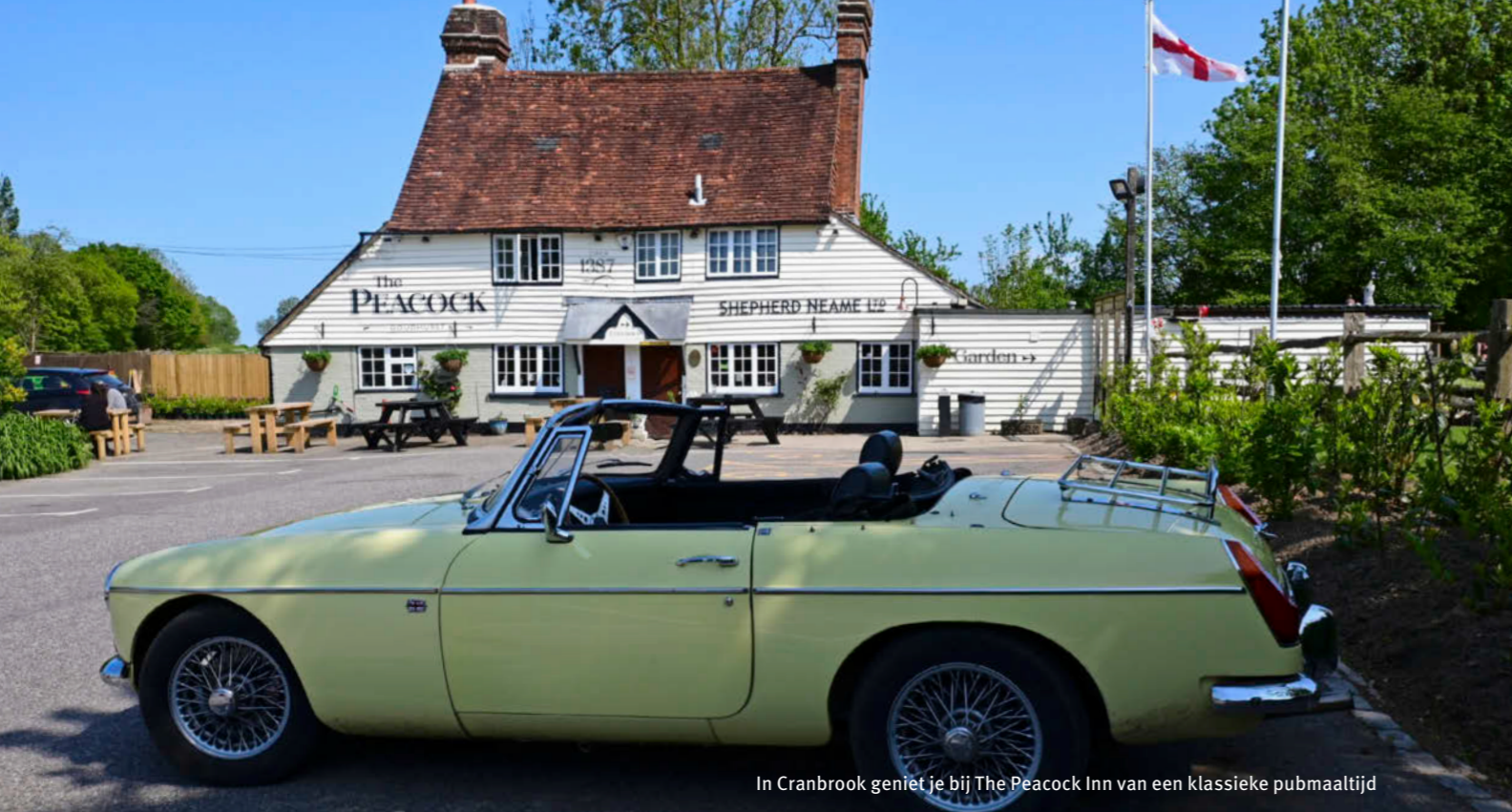
In Cranbrook geniet je bij The Peacock Inn van een klassieke pubmaaltijd