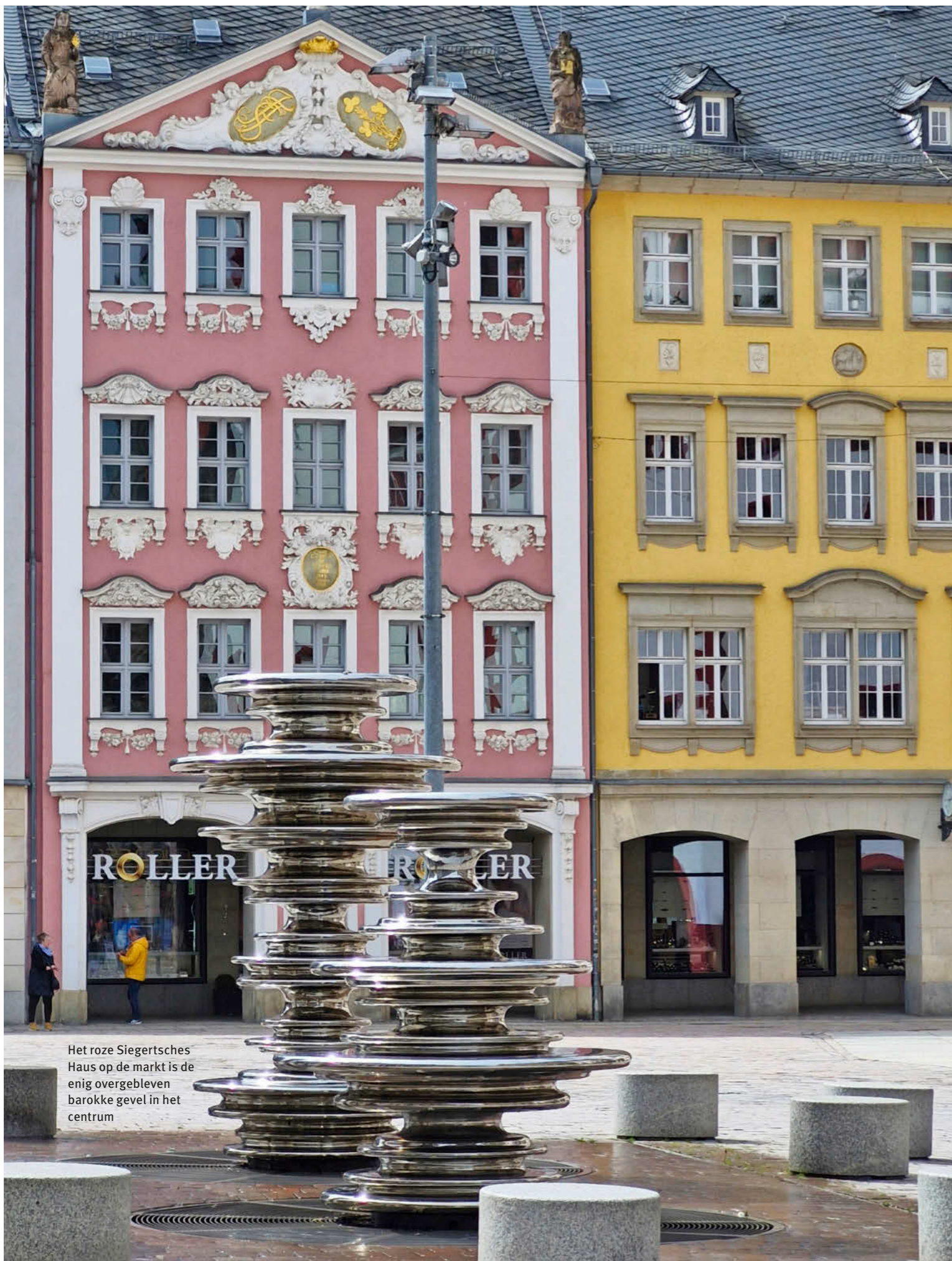
Het roze Siegertsches Haus op de markt is de enig overgebleven barokke gevel in het centrum