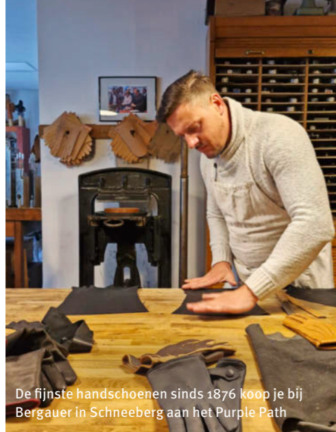
De fijnste handschoenen sinds 1876 koop je bij Bergauer in Schneeberg aan het Purple Path