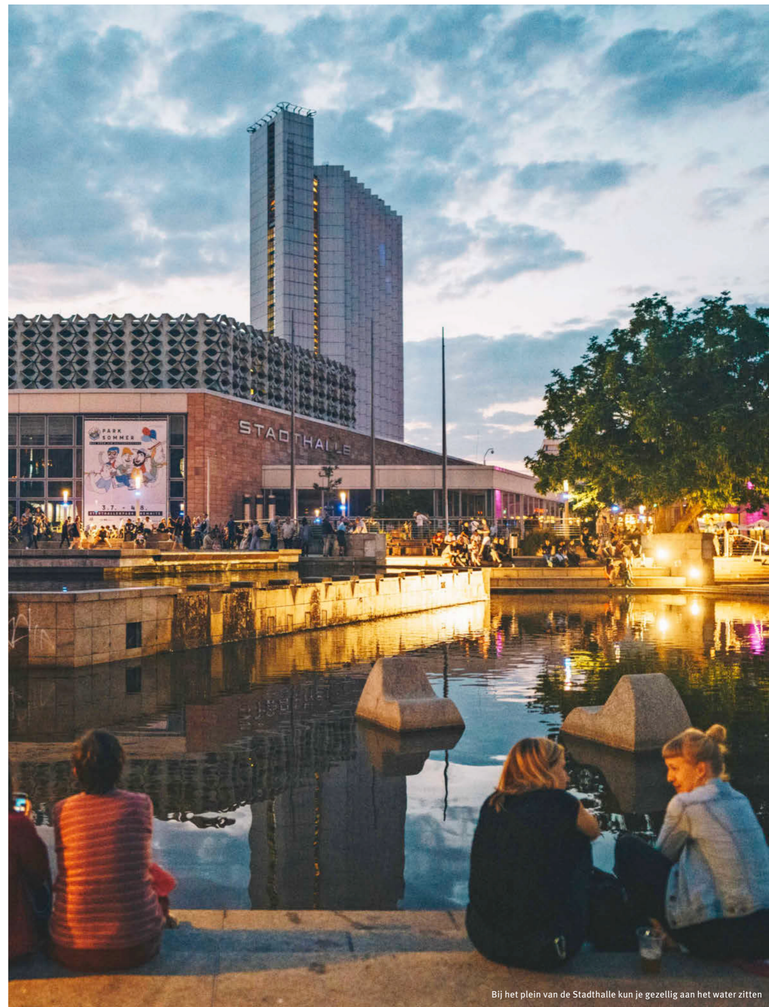
Bij het plein van de Stadthalle kun je gezellig aan het water zitten

Bij Restaurant Kellerhaus serveren vrolijke serveersters in klederdracht, de traditionele Duitse keuken. Het restaurant zit in een gerestaureerd vakwerkhuis, aan de voet van de Schlossberg. Kellerhaus-chemnitz.de