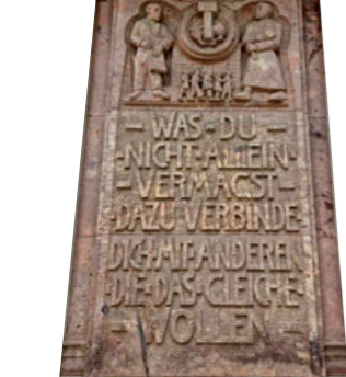
Tekst die herinnert aan de voormalige DDR-periode: 'Was Du nicht allein vermagst, dazu verbinde dich mit anderen, die das gleiche wollen'

O ké. Het is even omschakelen. Gezelligheid is in het centrum van Chemnitz ver te zoeken. Geen knusse steegjes en lieflijke pleintjes, maar straten breder dan de Parijse Avenue des Champs-Élysées en veel troosteloze hoogbouw. Oorzaak is het communistische verleden én: Chemnitz was een industriestad. Dat betekent echter niet dat je de derde stad in de deelstaat Saksen tijdens je rondreis door Oost-Duitsland links moet laten liggen. Wie net even verder kijkt, ontdekt in Chemnitz een schat aan architectonische pannels. En dan zijn er nu ook nog de vele culturele evenementen in aanloop naar en tijdens het feestjaar.